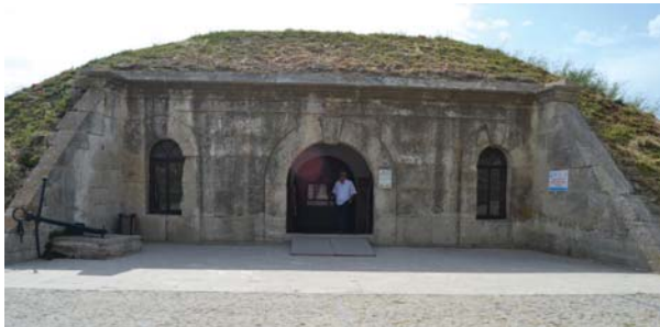
Tabyalardan müze ve gösteri mekânı olarak kullanılan bölümden bir görüntü.

"Padişah donanması 1. Komutanlığına atanan