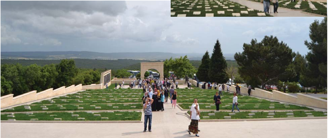
57. Alay Şehitliği'nden görüntüler.