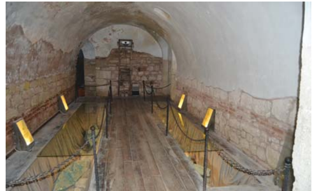
Müzenin teşhir mekânlarından bir görüntü.