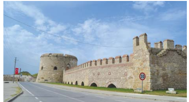
Kilitbahir kalesinden bir görüntü.

Şimdi buradan az ilerideki Namazgah Tabyası'na geçerek gezimize başlayacağız."