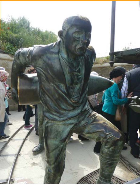
275 kg'lık top mermisini tek başına kaldırıp, savaşın seyrini değiştiren kahraman Seyit Onbaşı.