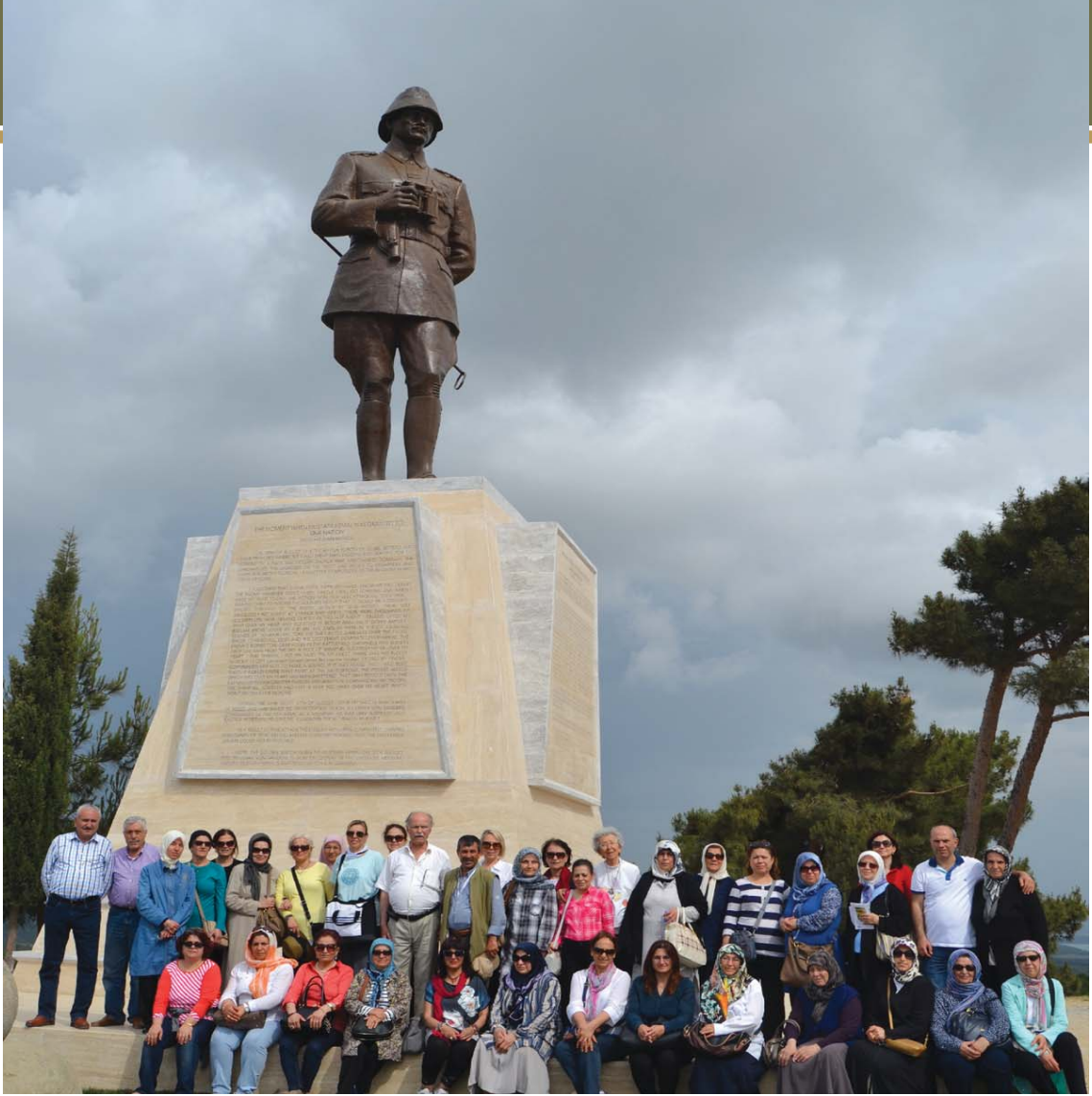
YOYAV gezi grubu, Conkbayırı Atatürk Anıtı önünde.

yerleşmişler, hücum anını bekliyordlardı. Gecenin karanlığı tamamen kalkmış, tan ağarmak üzereydi. 8. Tümen komutanı ve diğer subaylarını çağırdım.