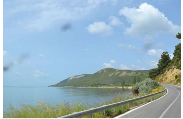
Seyit Onbaşı Anıtı'ndan Soğanlıdere Şehitliğine giden sahil yolu.

Aynı gün geç saatlerde Çanakkale Boğazı Müstahkem Mevki Kumandanı Cevat Paya, ödül olarak Seyid'e onbaşılık rütbesini verdi. Merminin bir defada kendi huzurunda kaldırılmasını istedi. Bunun üzerine Seyid Onbaşı, Cevat Paşa'ya şu cevabı verdi: “Ben bu mermileri kaldırırken gönlüm, Allah'ın feyziyle doldu. Ancak bu kuvvetin sırrı o anda bana Allah'ın ihsan ettiği bir vergi idi. Bu ağırlığı kaldıracak kadar bir makama varmışsam bu dua ve rıza ile olmuştur. Ancak şimdi kaldırmam mümkün değildir kumandanım.”