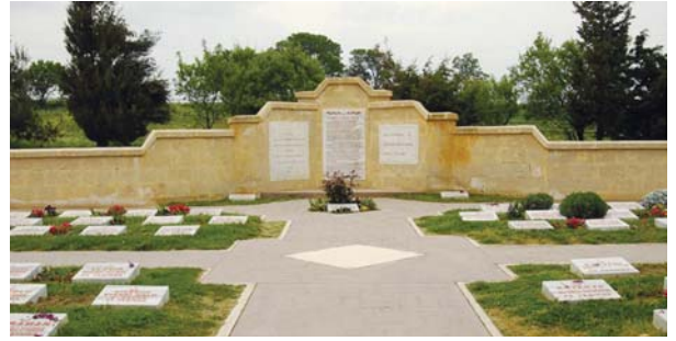
Yahya Çavuş Şehitliği'nden başka bir görüntü.

Biz de bu sözlere gönülden katılarak 57. Alay Şehitliğine gitmek üzere şehitlikten ayrıldık.