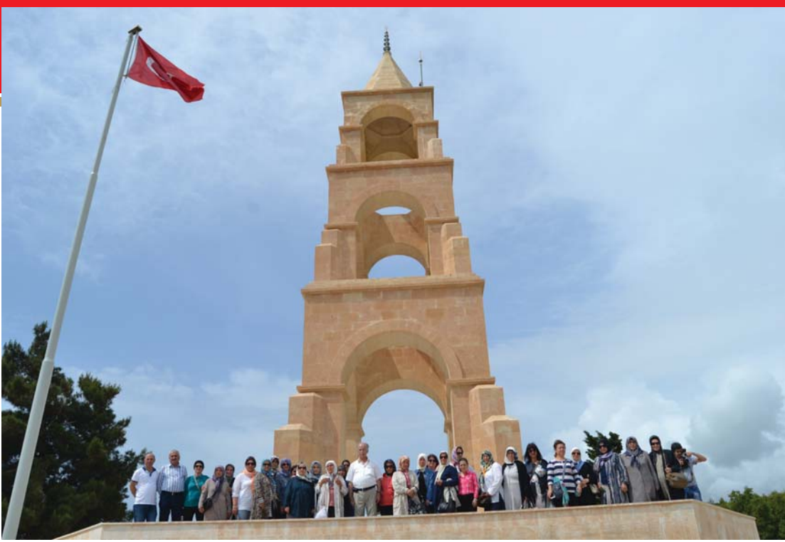
YOYAV gezi grubu, 57. Alaydaki anıt önünde.

mensup, değişik rütbelerde 25'i subay olmak üzere, 1.817 şehit askerin isimleri yer almaktadır.”