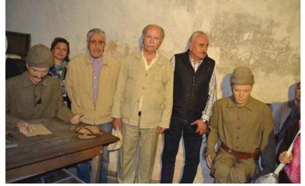
YOYAV gezi grubundan bir kısmı, müzedeki asker maketleriyle.

İnsanlık tarihi var oldukça sizleri minnetle anacağız. Aziz şehitlerimiz ruhlarınız şâd olsun.