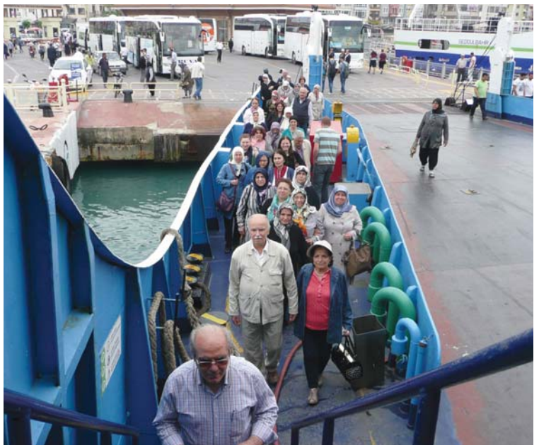
YOYAV gezi grubu, Çanakkale iskelesinde feribota binerken.