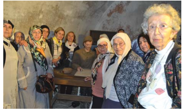
YOYAV gezi grubunun diğer bir kısmı, müzedeki asker maketleriyle.