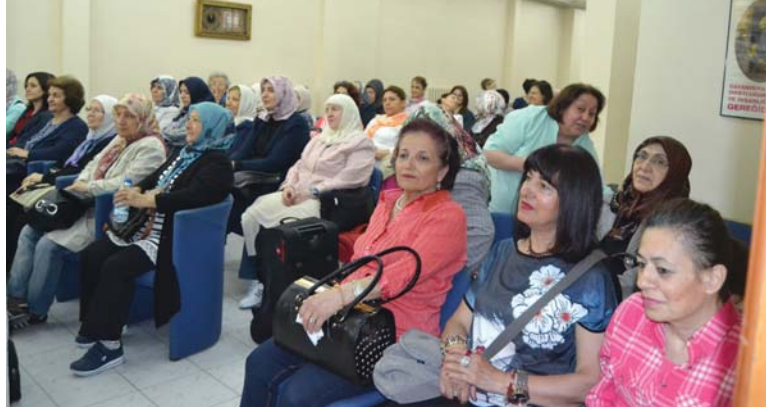
Geziye katılanlardan bir grup.

İlâhî yâ Rabb-el âlemîn! Cennet vatanımızı düşman işgalinden korumak, kurtarmak ve bizlere huzur içinde yaşayacağımız bir vatan armağan etmek için şehadet şerbetini içen o yüce ruhlu atalarımıza bizleri lâyük torunlar eyle yâ Rabbî. Onları sadece böyle bir Zaferin 100. yıldönümü dolayısıyla değil, her zaman hürmetle, muhabbetle, rahmetle ve mağfiretle anmayı, hâtıralarını hâfızalarımıza nakş etmeyi, onların emânetine sâhip çıkma duygusunu geliştirmeyi bizlere nasip eyle yâ Rabbî. Böylesine hayırlı ve mübârek bir yolculuğa çıkan bizlerin adımlarımızı isâbetli ve davranışlarımızı dirayetli, bakışlarımızı basîretli eyle yâ Rabbî. Hayat boyu her zaman ve her yerde amacımızı Hak, yüzümüzü ak eyle yâ Rabbî. Bizleri Sana lâyük kul, Resûlüne lâyük ümmet, mü'minlere lâyük kardeşler eyle yâ Rabbî. Bu cennet vatanın kadrini, kıymetini bilip, O'nu kötü düşünceli kimselerle, düşmanlarımızın sinsi emellerinden koruma gayretini, kuvvetini bizlere ihsân buyur yâ Rabbî.