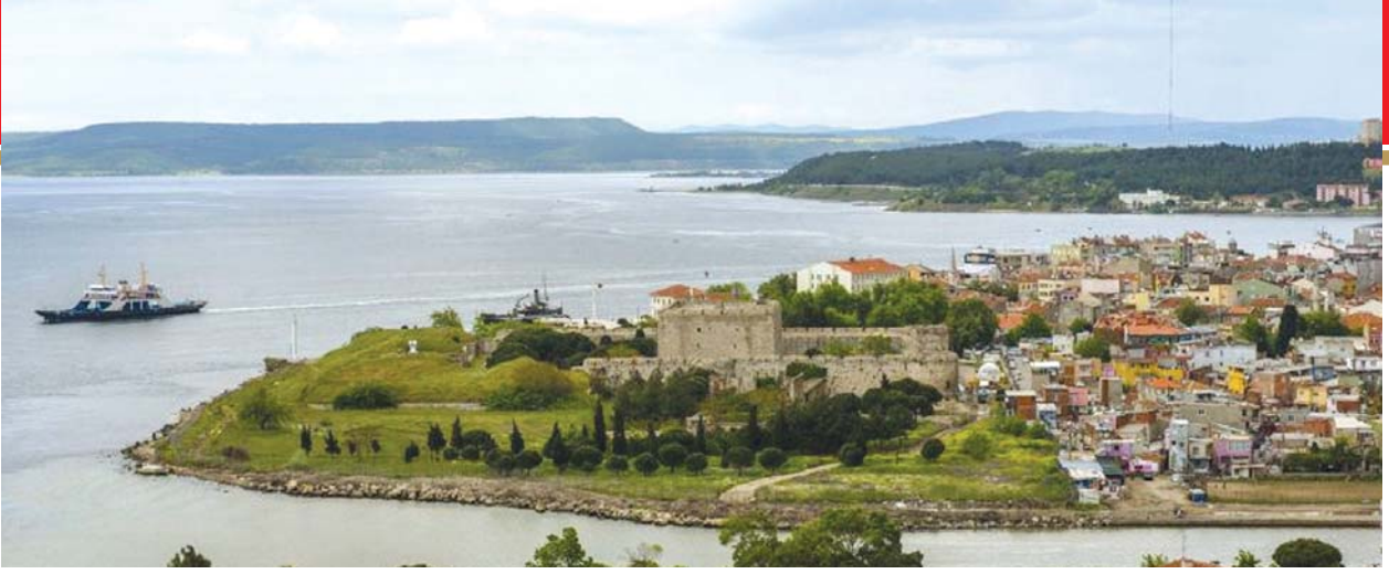
Çimenlik kalesi ve Çanakkale boğazından bir görüntü.

çıkıp 29 Mayıs'ta İstanbul'un fethi arasında geçen dört aylık süreçte Çanakkale boğazı kaderine terk edilmiş, hiçbir önlem alınmamıştı. Bu açığı gören Avrupalı buradan gemi yolu ile Bizans'a savaş malzemesi, erzak vs. takviyesi yapmış. Yani boğaz o süre içinde sahipsiz bir gümrük kapısı hâline gelmiş. Bu hususu belirleyen rapor gelince 27 bin kişi göndererek 1-1,5 yıl içinde bu görkemli kaleyi yapıyor. Kale duvarlarının taban kalınlığı 6.5 metre. Yüksekliği de 18 metredir. Kalenin içinde 35 metre yüksekliğinde bir kule bulunmaktadır. 35 metre olmasının sebebi buradan boğazın girişi 35 kilometredir. Tepesine çıkan gözetleme görevlisi bir asker 35 kilometre uzaklıktaki boğazın girişini görüyor.