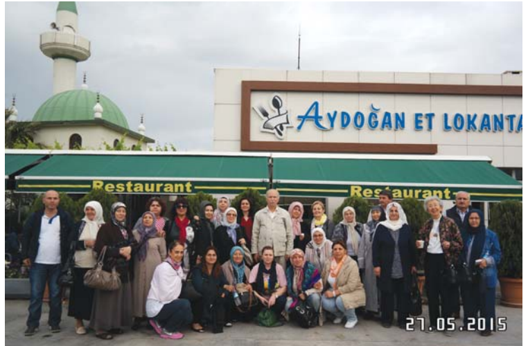
YOYAV gezi grubu, Çanakkale yakınlarında yaptığı kahvaltısı sonrası toplu halde.