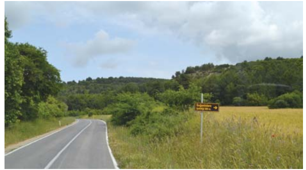
Soğanlıdere Şehitliği'nden Şehitler Âbidesi'ne giden yol.