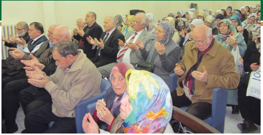
Hatim duasına katılanlardan bir grup.

ren yol'da yürümek ve bu yolda canı, Canan'a feda etmek büyük bir fedakârlıktır. Bunun için Cenâb-ı Hak kendi yolunda ömür tüketip hayatlarını bağışlayanları sıradan kullara göre çok özel iltifatlarla ağırlayacak ve onları aziz eyleyecektir.