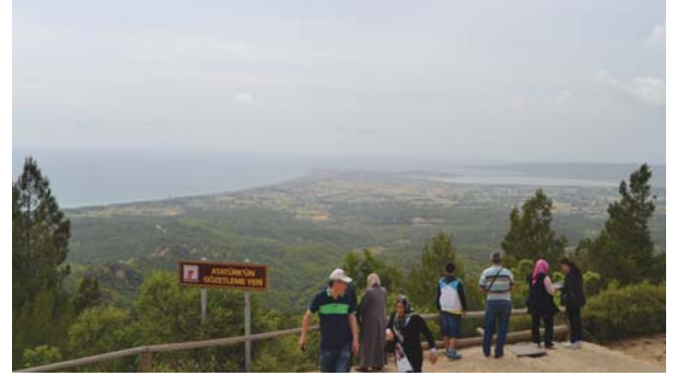
Conkbayırı'nda Atatürk'ün gözetleme yeri.