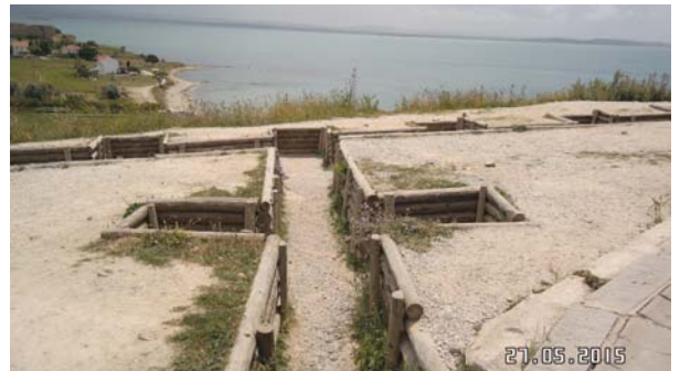
Yahya Çavuş Şehitliği'nin önündeki siperlerden bir görüntü.