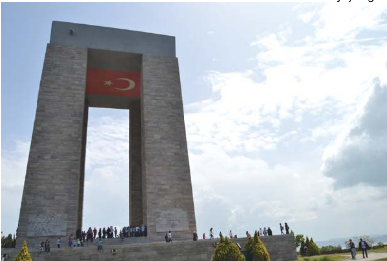
Ziyaretçilerle dolup taştan Şehitler âbidesinden bir görüntü.

Âbide de 250.000 şehidimizi temsilen 250.000 mimari parça kullanılmıştır. Dört sütun üzerine oturtu-