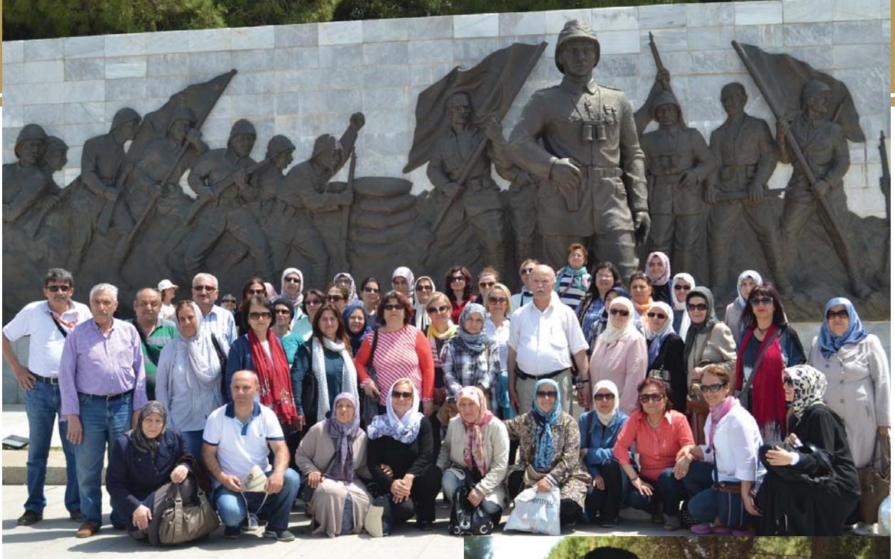
YOYAV gezi grubu, Şehitler Âbidesi alanındaki rölyef önünde.

lan âbide milletimizin sağlam temellere dayandığını ve yıkılmaz olduğu anlamını taşımaktadır. Uzaktan bakıldığında Mehmetçğin M harfi şeklinde gözük- mektedir. Âbidenin dört ayağında sekiz rölyef bu- lunmaktadır. Denize bakan dört tanesi deniz savaş- larını, karaya bakan dört tanesi de kara savaşlarını anlatmaktadır. 2005 yılında restorasyondan geçen anıt, 2007 yılında bulunduğu alana yeni şehitlik inşa edilerek son şeklini almıştır.