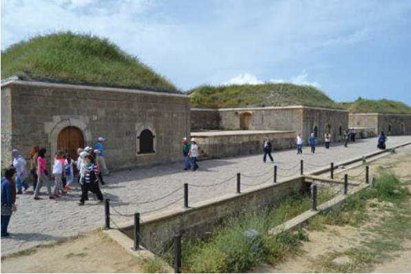
Mecidiye tabyasından bir görüntü.

merkez istihkâmlarından biriydi. Tabyada 8 adet bonet, 16 top yeri vardır. Bonetler kesme taşlarla yapılmış ve üzerleri toprakla örtülmüştür. Tabyada 4 adet 24 cm. çapında ve 2 adet 28 cm. çapında top bulunmaktaydı.