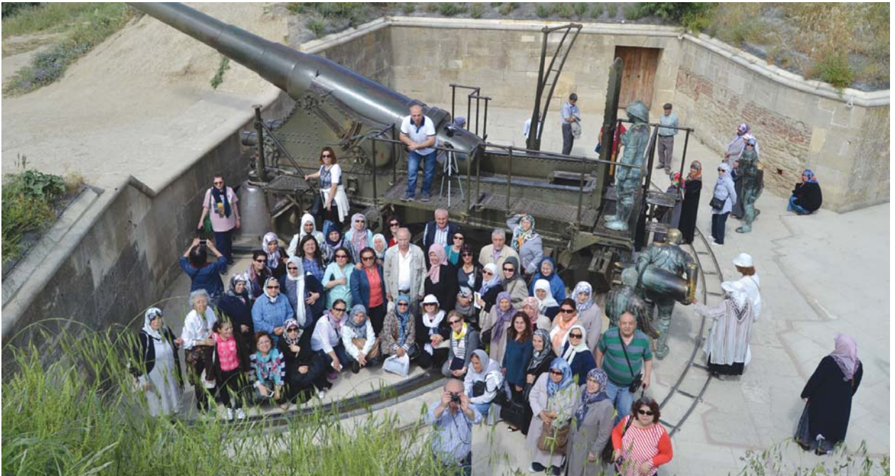
YOYAV gezi grubu, Seyit Onbaşı'nın kullandığı krupp topu hakkında bilgi alırken.

Krupp Topu: Mecidiye Tabyasında bulunan Alman yapımı bu toplardan günümüze sağlam vaziyette sadece üç tane kalabildi. Bir tanesi Çanakkale Cumhuriyet Meydanında, ikincisi Harbiye Açık Hava Müzesinde, üçüncüsü ise Mecidiye Tabyasında yer almaktadır. Topun hemen yanında o günü bizlere yaşatabilmek için Seyit Onbaşı'nın meşhur fotoğrafında yer alan kareler, heykel ile canlandırılmaktadır.