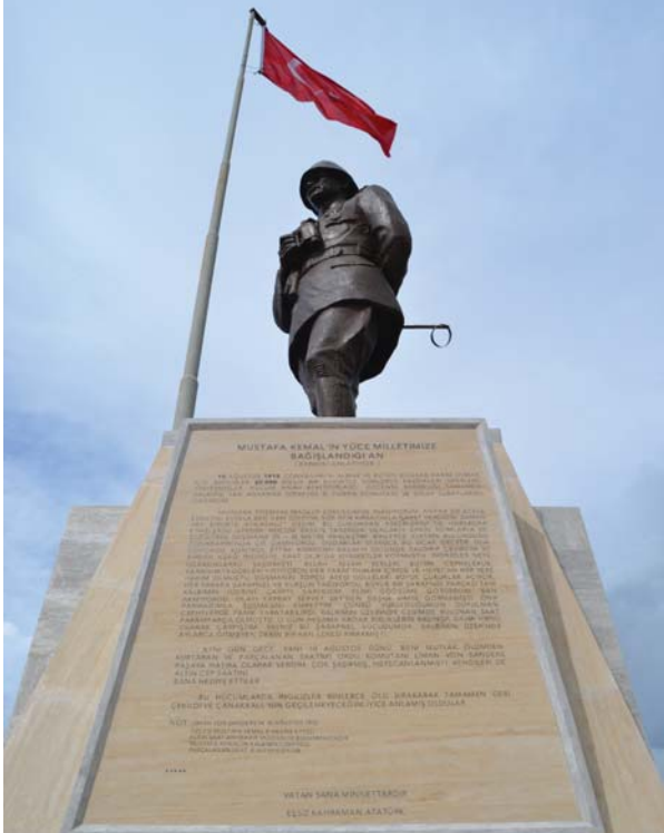
Conkbayırı Atatürk Anıtı.

10 Ağustos 1915. Conkbayırı'nı almak ve bütün boğaza hakim olmak için İngilizler 20.000 kişilik bir kuvvetle günlerce kazdıkları siperlere