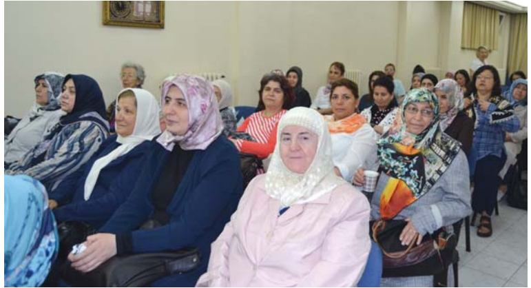
Geziye katılanlardan başka bir grup.