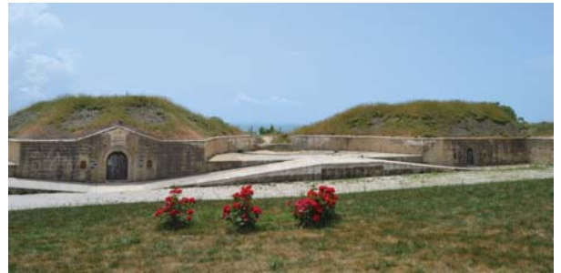
Yahya Çavuş Şehitliği'nin yanındaki Ertuğrul Tabyasından bir görüntü.