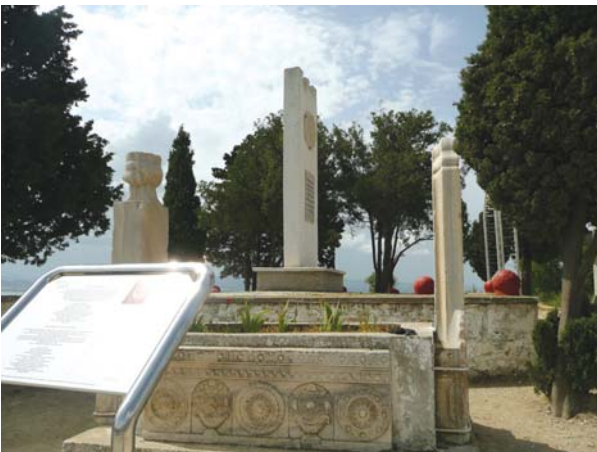
Mecidiye şehitliğinden bir görüntü.