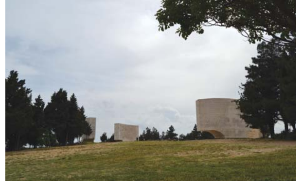
Conkbayırı Mehmetçik Kitabeleri.