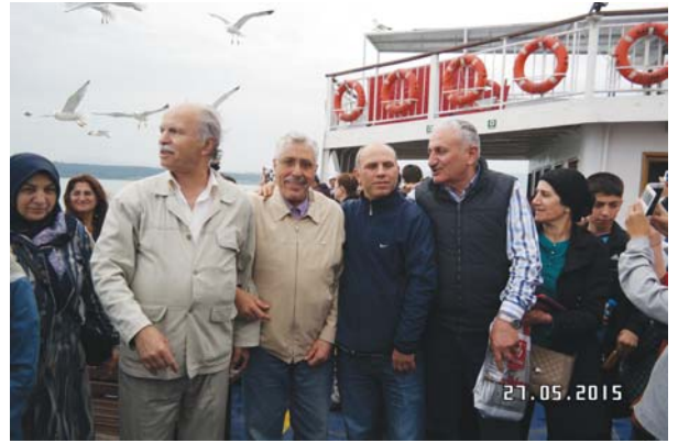
YOYAV gezi grubu feribotta üzerlerinde uçan martılarla.

Kale, gördüğünüz gibi görkemli bir kale. Ka-