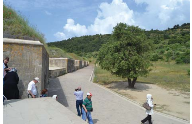
Mecidiye tabyasından başka bir görüntü.