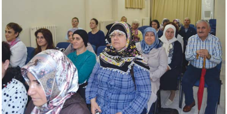
Geziye katılanlardan diğer bir grup.

İlâhî yâ Rabb-el âlemîn! Huzurla, mutlulukla gidip, huzurla, mutlulukla dönmeyi nasip eyle. Her yolculuğumuzda olduğu gibi, bu yolculuğumuzda da bizleri Senin himâyende, hidâyetinde ve inâyetinde olan kullarından eyle yâ Rabbî. Hâmî ismine sığınıyoruz, bizleri kuru ve kolla yâ Rabbî. Himâyeni bizlerden, milletimizden, yakınlarımızdan, yavrularımızdan esirgeme yâ Rabbî. Bizleri ömür boyu Sana kullukta kaim, îmân, ibâdet ve istikamette dâim eyle yâ Rabbî."