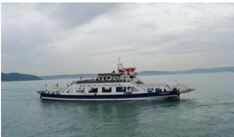
Çanakkale-Eceabat arası sefer yapan feribotlardan biri.

Eceabat'a ulaşım feribottan inerek yarımada'daki kaleler, tabyalar ve savaşın geçtiği diğer mekânlarla şehitlerin yattıkları yerleri bir an önce gezip görmek