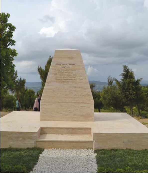
Üsteğmen Nazif Çakmak Şehitliği.