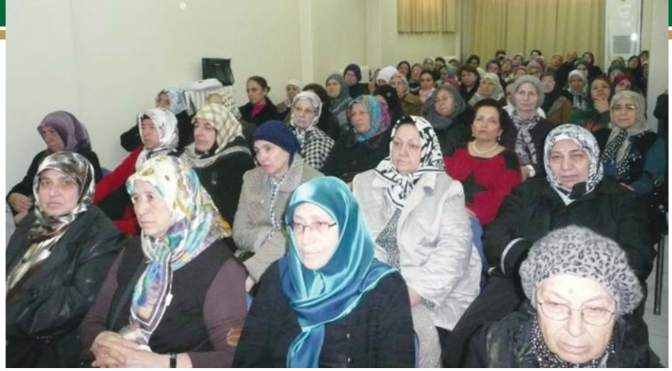
Toplantıya katılanlardan bir grup.

yup nesilden nesile evlâd ve ahfâdımıza değerli bir emanet olarak aktarmanın gayret ve kararlılığı içinde, ona yan bakanın gözünü oyacağımızı ve şehitlerimizin uğruna canlarını verdikleri kutsal değerlerimizin yoluna baş koyacağımızı dost-düşman herkesin duymasını ve bilmesini isteriz.