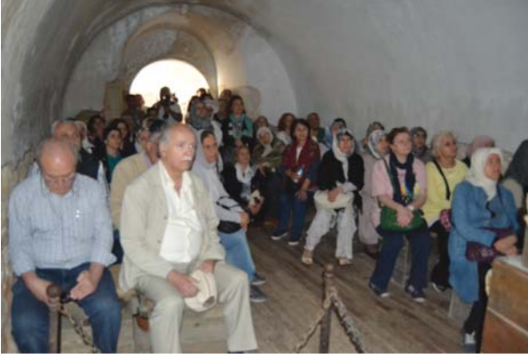
YOYAV gezi grubu, sunulan sinevizyon gösterisini izlerken.