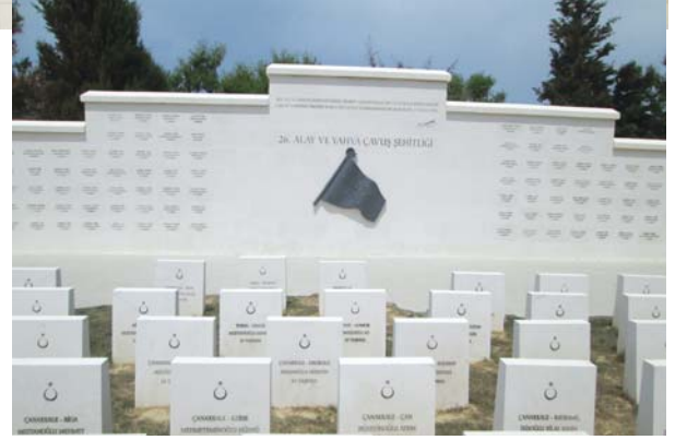
Yahya Çavuş şehitliğinden bir görüntü.