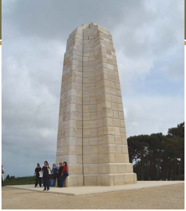
Conkbayırı Yeni Zelanda (Anzak) Anıtı.