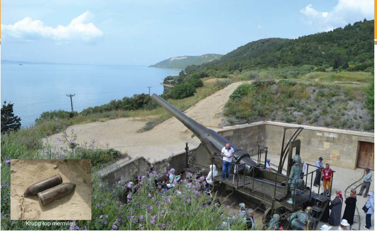
Krupp top mermileri.