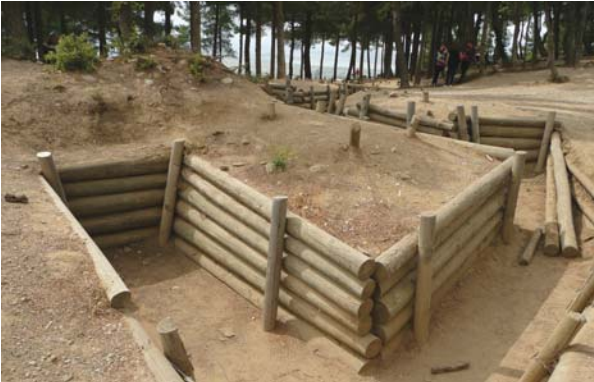
Conkbayırı'ndaki siperlerden görüntüler.

Conkbayırı'nın hemen alt tarafında bulunan tepenin üzerine dikilmiştir. Kitabeler bir eli sembolize eden beş adet yazıtın oluşmaktadır. Anıt, Conkbayırı'nda vatani için çarpışırken şehit olan askerlere adanmıştır. İki 10 Ağustos 1981 açılmış olup, diğer dört yazıt da 1984 yılında tamamlanmıştır. Yazıtlarda, Arıburnu-Conkbayırı bölgesinde cereyan edene muharebeler hakkında özet bilgiler yer alır.