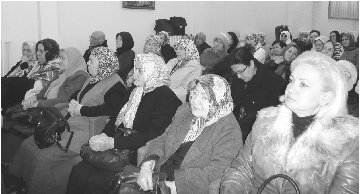
Davetlilerden bir grup.

Bu noktadan hareketle tevbe, iman ve salih amellerin, kulların kurtuluş vesilesi olduğu söylenebilir. Ne mutlu bu vesileye tevessül edip kötülüklerini iyiliklere çevirecek böylesi duyarlı ve dirayetli davranışlarda bulunanlara! Ne yazık ki bu gerçeği görmeyen ve ebedi kurtuluşa ermeyenlere!