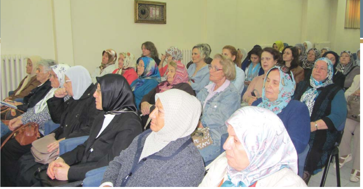
Programa katılanlardan bir grup.

şıyoruz. Gerek miladî, gerekse hicrî yılbaşı olsun, hepimizin hayatında bir dönüm noktası olan bu geceleri duyarsız, dirayetsiz davranışlar, baş döndürücü eğlenceler ve akli âtil hâle getirip düşüncelere durgunluk veren içki âlemleri ile değil, düşünce dünyamızda yeni ufuklar açacak, hayatımızdaki artı ve eksileri gözden geçirip kendimize önümüzdeki yıl daha iyi ve faydalı bir insan olabilmek için neler yapmalıyım? sorusunu sorup cevaplarını araştıracak değerlendirmelerde bulunmaya vesile olmalıdır.