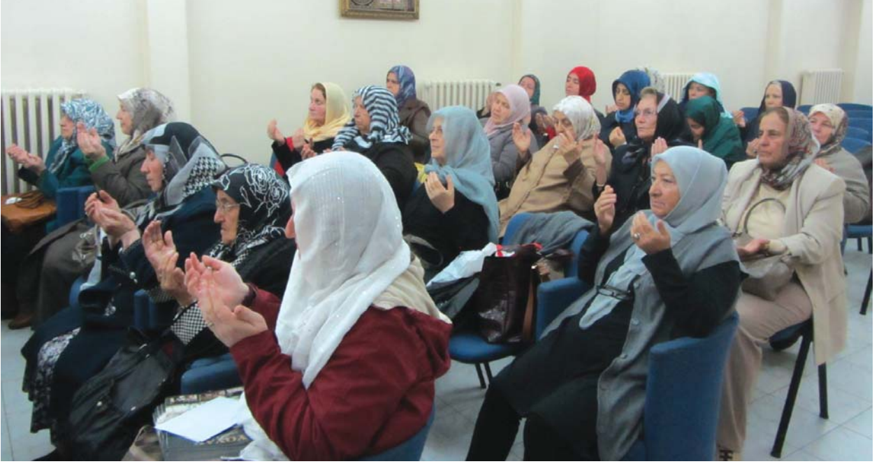
Hatim duasına katılanlardan bir grup.

olmak üzere Cumhuriyetimizi kuran ve kollayan büyüklerimizin ruhlarına senden rahmet diliyoruz, rahmetini onlardan esirgeme yâ Rabbî.