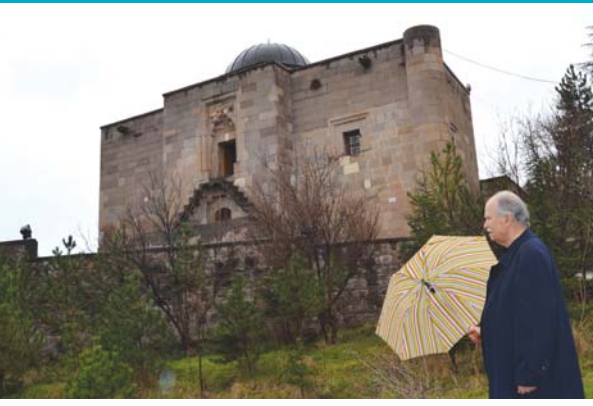
Taş Mescid'in kuzey cephesi.