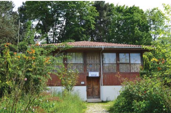
Göktepe Köyü Evliya Camii.