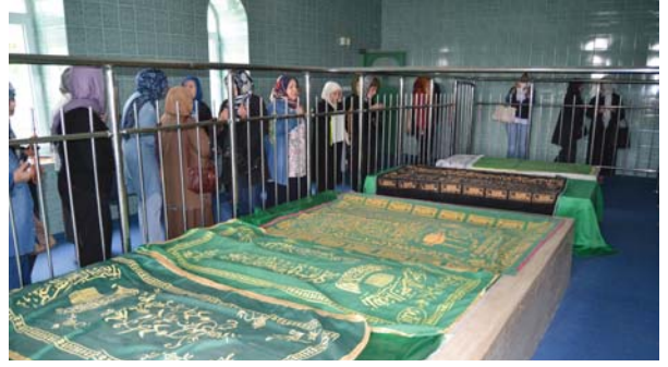
YOYAV gezi grubu, Abalı Baba Türbesi'nde.

many'a'dan döndükten sonra son anlarını Ankara'da bir otel odasının mütevazı şartlarında eşi ile birlikte yalnız başına, eski tanıdığı dostlarıyla geçirmiş, ömürleri ağır riyazet ve çilelerle, büyük sıkıntılar, dertler içinde insanlardan uzak, namsız-nişansız bir kul olarak geçmiştir