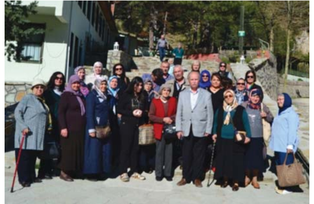
YOYAV gezi grubu Sünnet Gölü kıyısındaki otelin yanında.

Birlikte feyizli ve güzel bir gün geçirmenin mutluluğu içinde Bolu-Gerede-Kızılcahamam güzergâhından Ankara'ya doğru dönüşe geçen YOYAV gezi gurubu saat 22.00'de Vakfın önünde otobüslerinden inerek güzel bir geziye katılmanın ve unutulmaz bir gün yaşamının mutluluğu içinde arkadaşları ile vedalaşıp benzeri güzel bir gezide buluşmak dileğiyle evlerinin yolunu tuttular.