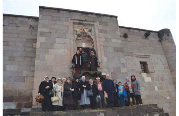
YOYAV gezi grubu, Taş Mescid portal kapısı önünde.

Konaklama için kayak merkezi içerisinde ve yakın çevresinde 8 tesis bulunmaktadır.