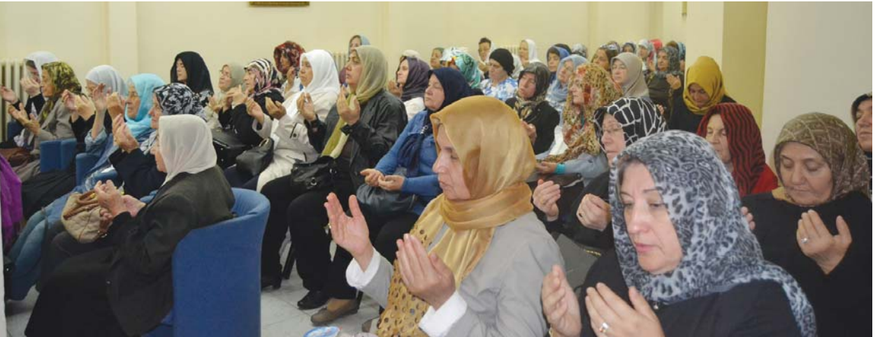
Şehitler için yapılan hatim duasından bir görüntü.

"Üzerinde yaşadığımız cennet vatanımızı bizlere emanet ve armağan eden devlet büyüklerimizle, vatan uğruna canlarını seve seve feda eden şehitlerimize milletçe medyûn-u şükranız. Onlar için ne yapsak azdır. Bizi ve vatanımızı koruma yolunda şehadet şerbetini içen şehitlerimizi kalbimizde yaşatıyor, her zaman ruhlarına rahmet diliyoruz. Ruhlarının şâd, mekânlarının cennet ve makamlarının yüce olmasını niyaz ediyoruz. Özellikle 15 Temmuz akşamı FETÖ terör örgütünün yaptığı hain darbe girişiminde millet ve memleketimizle devletimizi korumak için, teröristlere karşı göğüs gerip, şehadet şerbetini içen kahraman 241 şehidimizi minnet ve mağfiretle yad ederek, yüce Allah'tan ruhlarına rahmet diliyoruz. Okuduğumuz hatm-i şerîflerle diğer süver-i şerîfelerin sevabını ruhlarına armağan ediyor, cennet ve Cemalullah ile ödüllendirilmelerini diliyoruz."