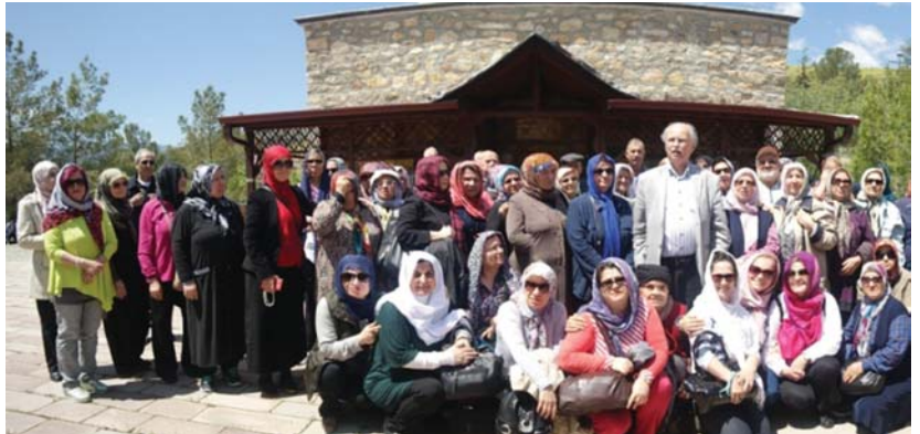
YOYAV gezi grubu Tapduk Emre Türbesi önünde.

Türbenin bulunduğu Emrem Sultan Köyü'ne geldiklerinde otobüslerinden inip yolun sağında ve solundaki vecizeleri okuyarak saygılı adımlarla türbeye doğru ilerlediler.