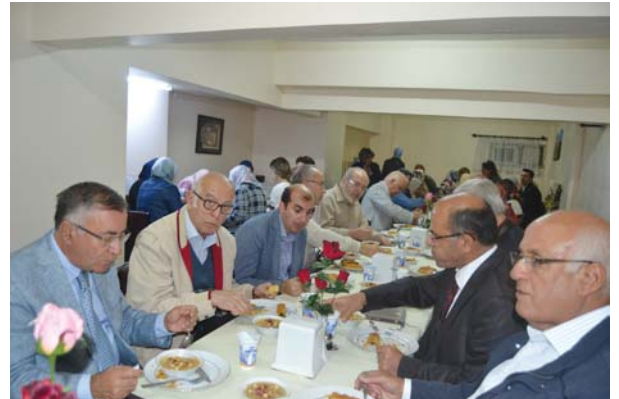
15.10.2016 tarihindeki aşure ikramından bir görüntü.

Davetimize icabet ederek bu toplantılara katılıp bizimle birlikte olma inceliğini gösteren dost ve kardeşlerimize takdir ve teşekkürlerimizi iletiyor, ikram edilen aşurelerin giderlerini karşılayan mensuplarımıza da şükranlarımızı sunuyor, ilahi ikram ve ihsana nail olmalarını niyaz ediyoruz.