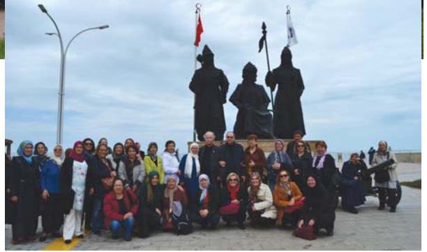
YOYAV gezi grubu, Akçakoca Bey, Orhan Gazi ve Konuralp Bey'in heykelleri önünde.

“Görmek istiyorsan yeşili, moru, Çevreyi temiz tut, doğayı koru. Duymak istiyorsan hazzı, huzuru, Yurttaşını gözet, yurdunu koru.”