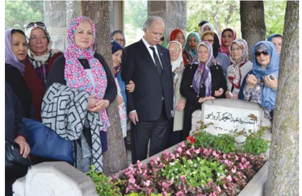
YOYAV gezi grubu, Abdülhakîm Arvasî'nin kabri başında.

Hz. Peygamber (s.a.v.)'in kabr-i şeriflerini ziyaretin dışında kadınların mezarlığa alınmadığı bu ülkede, onbin civarında sahabînin medfun olduğu Medine mezarlığı Cennetü'l Baki'de medfun olan Hz. Aişe ile Hz. Fatıma (R.Anhüma)'yı ziyaret etmek isteyen kadınları mezarlığa almazlar. Keza bir o kadar sahabî ile büyük insanların medfun olduğu Mekke mezarlığı Cennetü'l