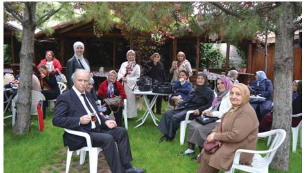
YOYAV gezi grubu, Mengen sofrası bahçesinde.

2 Aralık 1989 Cumartesi günü Hakk'a yürümüş, sevenleri O'nu Ankara'nın kuzeybatısında, yaklaşık 15 kilometre mesafedeki Memlük köyünde toprağa vermişlerdir."