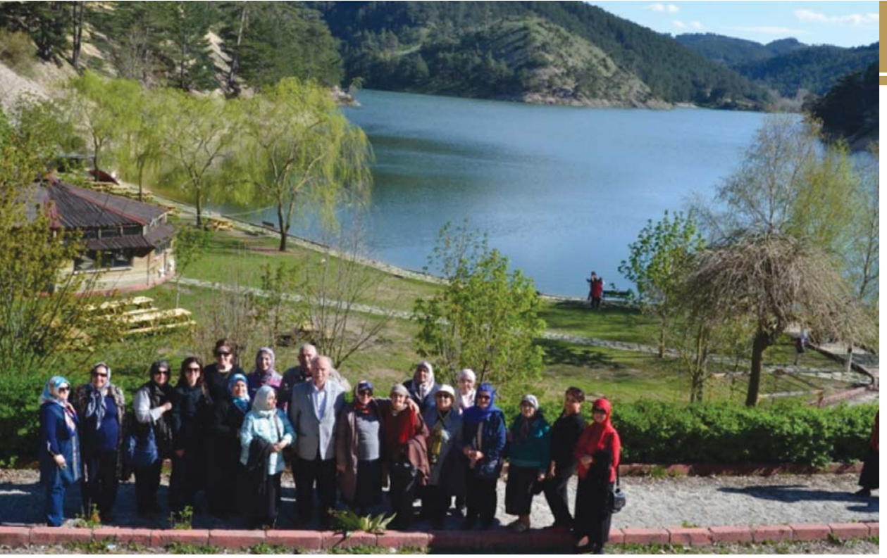
YOYAV gezi grubu Sünnet Gölü'nde.

üzere gitmiştir. Fakat O'na talebe olamamıştır. Halep'te bulunan Şeyh Zeynüddîn'e talebe olmak için Haleb'e giderken, gördüğü bir rüya üzerine Hacı Bayram-ı Veli'ye talebe olmak üzere Ankara'ya geri dönmüştür. Hacı Bayram-ı Veli tarafından kabul edilip, O'nun sohbetinde tasavvuf yolunun bütün inceliklerini öğrenmiş ve Hacı Bayram-ı Veli'den icazet (diploma) almıştır.