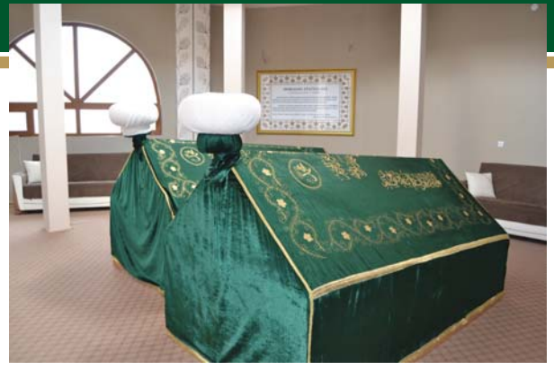
Bağlum Merkez Camii girişindeki Yusuf ve Sadık Velilerin sandukaları.

Mualla da yatan Hz. Hatice (R.Anha)'nın kabrini ziyaret etmek isteyen kadınların da bu mezarlığa girmelerine müsaade etmezler. Kadınlar ancak mezarlığın ihâta duvarının dışında durarak mezarlıktaki mevtâlara Fâtiha okuyup ruhlarına armağan edebilirler. Erkekler ise sadece sabah ve ikinci namazlarından sonra kabir ziyareti için mezarlığı açarlar. Kadınlar neden Mekke ve Medine mezarlıklarındaki İslam büyüklerinin mezarlarını ziyaret edemesinler? Allah'a şükür bizde öyle değil. Dileyen herkes Eyüp Sultan'ı, Hacı Bayram-ı Veli'yi, Mevlana Celâleddîn-i Rûmî'yi, Hacı Bektaş-ı Veli'yi ve diğer mana büyüklerini ziyaret edebilir.