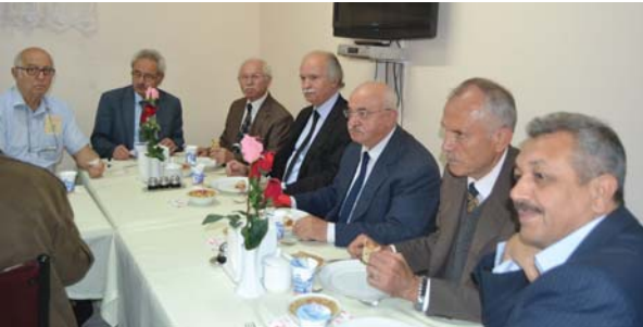
Toplantı sonu konuklara öğle yemeği ve aşure ikram edildi.

Hz. Hüseyin (r.a.)'in şehadetinin yıldönümü olan bugün, Muharrem ayının 10. günü olan âşûrâ günüdür. Bir taraftan bazı Peygamberlerle Hak dostlarının maruz kaldıkları sıkıntılardan kurtuldukları gün olduğu için sevinip hayır hasenâta bulunduğumuz önemli ve anlamlı bir gün yaşama-