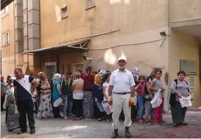
Kurban kesim mahallinden bir görüntü.

yaklaşık 1240 (binikiyüzkırk) TL. tutarındaki 2 kurbanın etinden oluşan toplam olarak 117.180 (yüzyedibin yüzseksen) TL. tutarındaki 189 kurbanın eti, 708 kişiye dağıtılarak yüzleri güldürüldü ve mutlu bir bayram geçirmelerine katkıda bulunuldu.