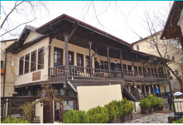
Buğday Pazarı Medresesi.