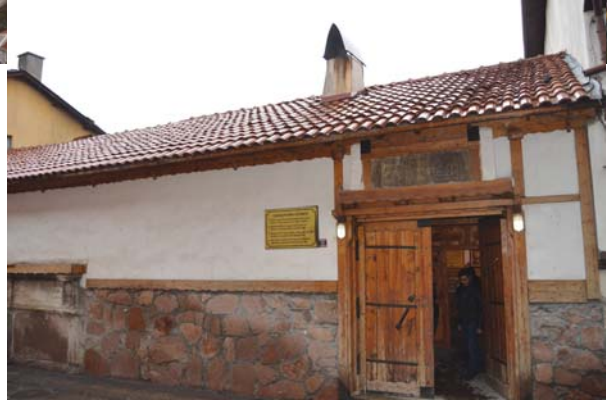
Abdulhamid Han döneminden kalma Çamaşırhane.

2016 yılının Ocak ayında düzenlediği "Abant'ta Kahvaltı" programına katılıp, unutulmaz anılarla dönen mensuplarının ısrarlı istekleri üzerine 5 Mart 2016 Cumartesi günü Ilgaz'a benzeri bir program düzenledi.