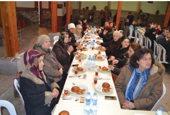
YOYAV gezi grubu Tarihî çamaşırhane binasındaki kahvaltıda.