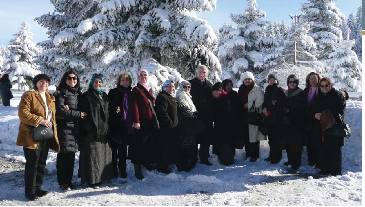
YOYAV gezi grubu, Abant yolculuğunda Kuru Otel civarında.

3- Mekân güzel, hava hoş ve tabiat hârika olmakla birlikte, böyle bir mekânda arkadaşlarınızla birlikte değil de tek başınıza bulunursanız, aynı sevinç ve saadeti hissedersiniz?