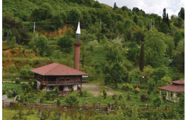
Hemşin Köyü'ndeki tarihî ahşap Osmanlı Camii.