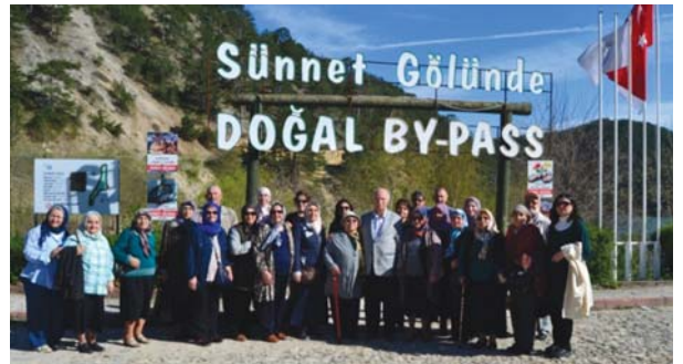
YOYAV gezi grubu Sünnet Gölü girişinde.