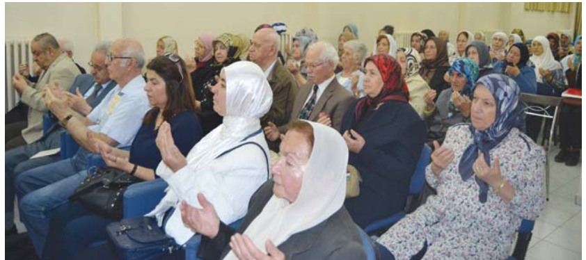
Duaya katılanlardan bir grup.