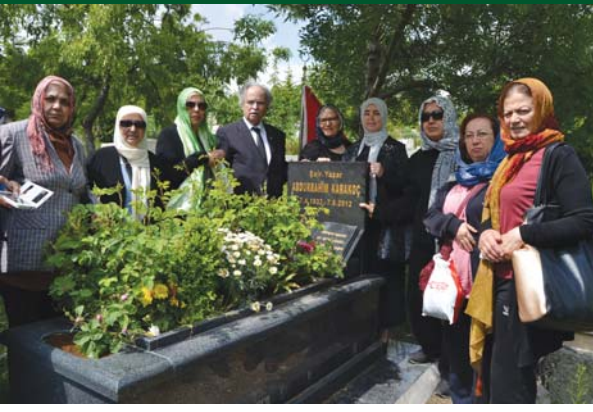
YOYAV gezi grubu, Şair Abdurrahim Karakoç'un kabri başında.