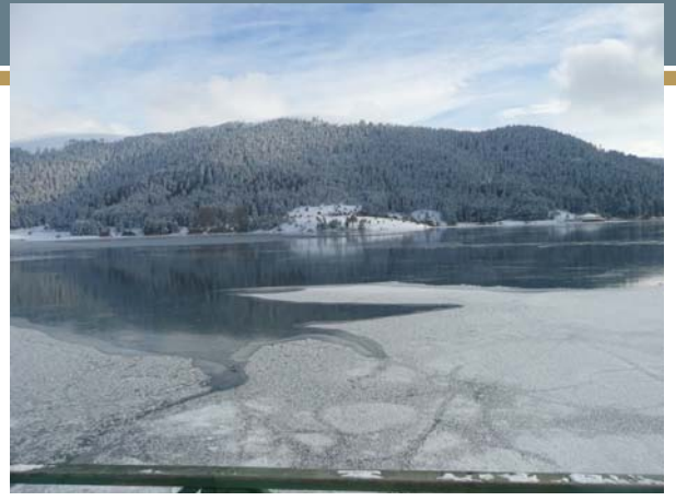
Abant Gölü'nün buzlarla kaplı hali.

Yıllar önce bir arkadaşım bana, Konya'daki bir mezar taşına bu şiirin yazılmış olduğunu gördüğünü söylemişti.