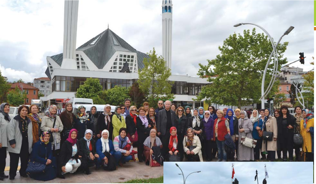
YOYAV gezi grubu, Akçakoca Merkez Camii önünde.