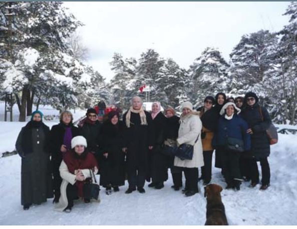
YOYAV gezi grubu, Abant yolculuğunda Kuru Otel civarında.