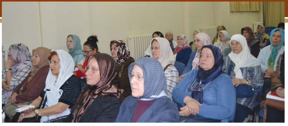
Toplantıya katılanlardan bir grup.

Demokrasi şehitleri olmak üzere tüm şehitlerin ruhlarına armağan edildi. Ardından günün anlam ve önemiyle ilgili konuşmalar yapıldı ve davetlilere Hz. Hüseyin (r.a.)'in ruhu için hazırlanan pide ve ayrıntı aşure tatlısından oluşan öğle yemeği ikram edildi.